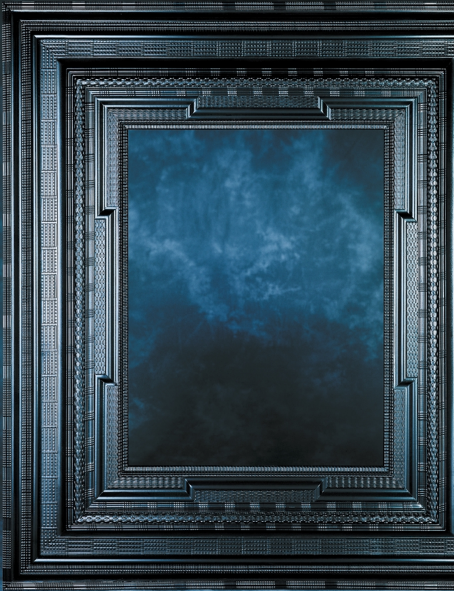
NIEDERLÄNDER BILDERRAHMEN, BREITE 120 CM, HÖHE 140 CM.